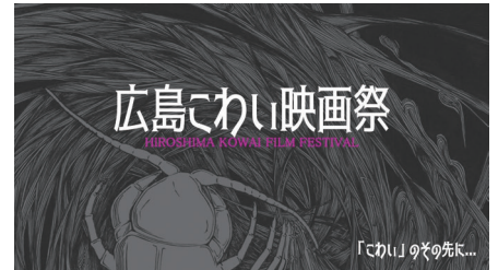
「広島こわい映画祭」メインビジュアル

★最新情報はTwitterで。ぜひフォローを。 https://twitter.com/hirokowa_movie