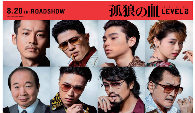
「孤狼の血 LEVEL2」8月20日(金)全国公開

しの中で必要だということを、そして、映画の力、映画館の力をより強く感じるようになった。広島フィルム・コミッションの活動は、映画が観客に届くまでのほんの一部分を担うにすぎないだろう。しかし、確実につなぎ、私たちの暮らしが少しでも豊かになればと願いながら“集える日常”を心待ちにしている。