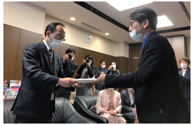
「SAVE the CINEMA」署名を政府に届ける諏訪敦彦監督