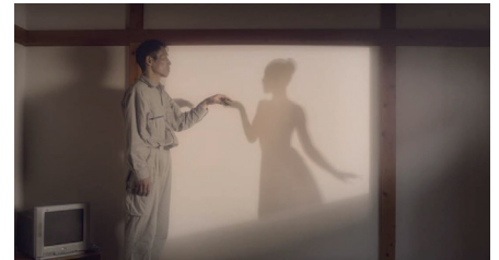
グランプリ受賞作品「声」(串田壮史監督)