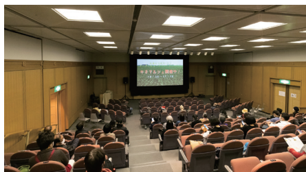
12月5日映画会場内風景