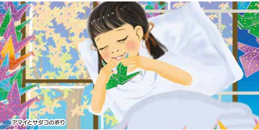
アマイとサダコの祈り

広島とアニメーションとの関わりを再発見し、アニメーションを広島の新しい都市文化の一つとして捉え直す機会となるよう、被爆体験をテーマにしたアニメーション、広島在住のアニメーション作家の作品など、広島ゆかりのアニメーションを特集します。