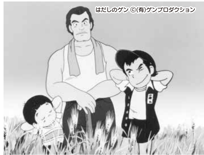
はだしのゲン ©(有)ゲンプロダクション