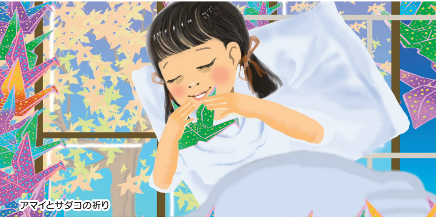
アマイとサダコの祈り

広島とアニメーションとの関わりを再発見し、アニメーションを広島の新しい都市文化の一つとして捉え直す機会となるよう、被爆体験をテーマにしたアニメーション、広島在住のアニメーション作家の作品など、広島ゆかりのアニメーションを特集します。