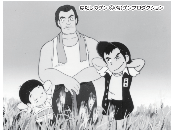
はだしのゲン ©(有)ゲンプロダクション