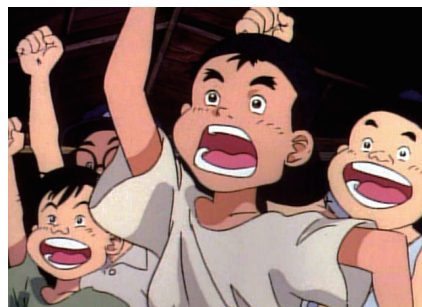
かっ飛ばせ!ドリーマーズ