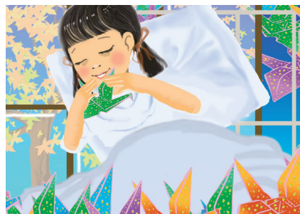
アマイとサダコの祈り